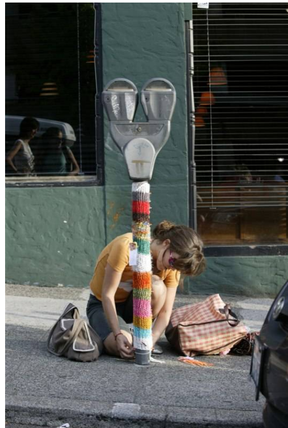
Neulegraffitti New Yorkissa

Vaikka neulemallit ja tavat on keksitty kauan sitten (nurja silmukkakin keksittiin jo 1400-luvulla), voi myös neulominen kehittyä ja uudistua. Yksi 2000-luvun uutuuksista on neulegraffiti. Neuloja jättää neuleensa johonkin näkyville, viestinä muille neulojille ja myös ei-neulojille. Mitä näkyvämpi paikka sen parempi. Neuleen voi kiinnittää lyhtypylvääseen, pysäköintimittariin tai jopa puuhun.