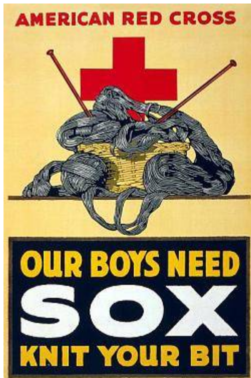
Amerikan punaisen ristin mainos

Puolustusvoimat tarvitsivat erityisesti sukia, paitoja, liivejä ja muita vaatteita sotilaille. Koska neulominen oli yleinen harrastus, ajattelivat kotirintaman naiset etteivät armeijassa palvelevat naiset tarvitse neuleita, hehän osaisivat itse neuloa ne! Myös jotkut kiinnijääneet sotilaat purkivat paitansa vankeudessa ja neuloivat niistä sukia sillä sukat kuluivat nopeammin rikki. Neulepuikkoina he käyttivät suoristettua piikkilanka-aitaa. Jotkut naiset jotka neuloivat puolustusvoimille kulkivat itse vanhoissa ja rikkinäisissä sukissa. (Becker, 2004)