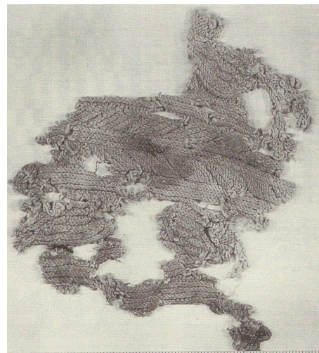
Ensimmäinen löydetty neule

Holacombe, 2006). Muun muassa näistä syistä oletetaan että arabit keksivät neulomisen. Neulomisen alkuperä tosin tuottaa erimielisyyttä. Theakerilla (2006) on esittää lisää argumentteja arabien puoleen. Kuten sanottu, vanhimmissa neuleissa on tekstiä ja niiden tekoaikaan valtaosa Euroopan väestöstä oli lukutaidotonta. Islamilainen maailma taas osasi kirjoittaa ja keski-ajalla – ja neuleiden teksti olikin arabiaa. Vanhimmat neuleet ovat myös silkkiä tai puuvillaa eikä villaa. Jos nämä olisi neulottu Euroopassa, olisivat ne todennäköisesti olleet villasta. Viimeinen perustelu jonka Theaker antaa on neulesuunta – oikealta vasemmalle (2006)!